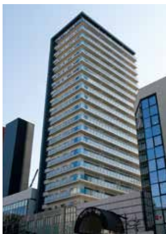
THE SENDAI TOWE