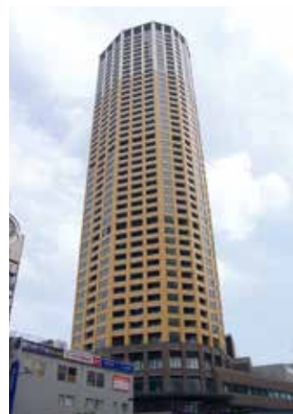
中目黒アトラスタワー