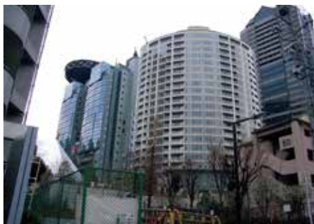
Akasaka The Residence