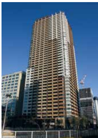
パークタワーグランスカイ