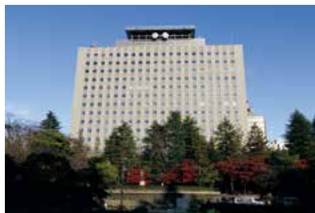
仙台第1地方合同庁舎