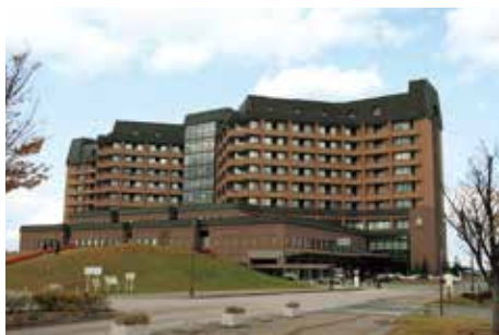
山形県立中央病院