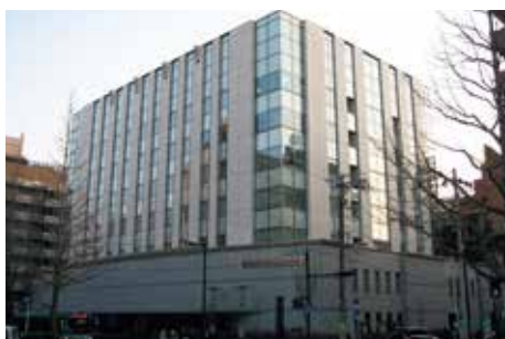
仙台第3法務総合庁舎