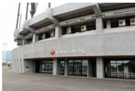
山形市きらやかスタジアム