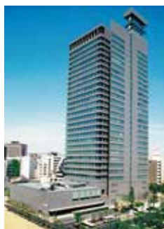
東北電力本店ビル(エナジースクエア)