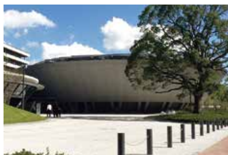
羽田クロノゲート「フォーラム棟」