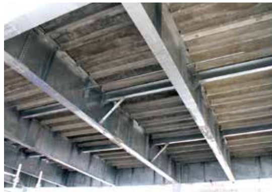
女川町地方卸売市場