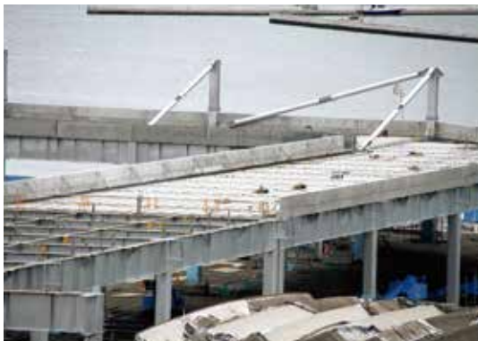
女川町地方卸売市場