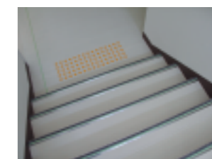
アルシオールステップ

津波発生時や災害時の地域避難ビルとしての役割も兼ねる、JA 仙台松島支店事務所に白御影石を採用した重厚感のある PCa カーテンウォールが採用されました。また避難を兼ねる階段には停電や夜間時にも安心して昇降できる、高輝度蓄光式防滑階段材「アルシオール・ステップ」（電気を必要とせず長時間発光）も採用されています。